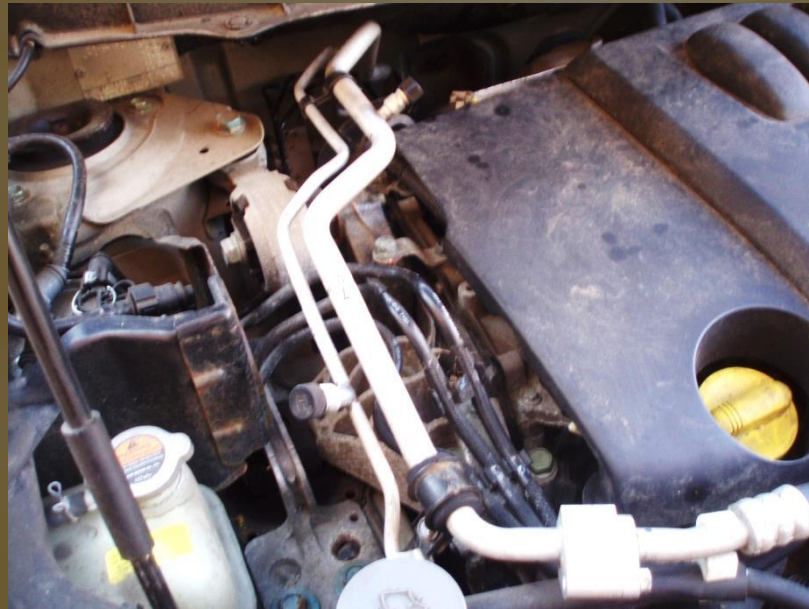
detail potrubí klimatizace